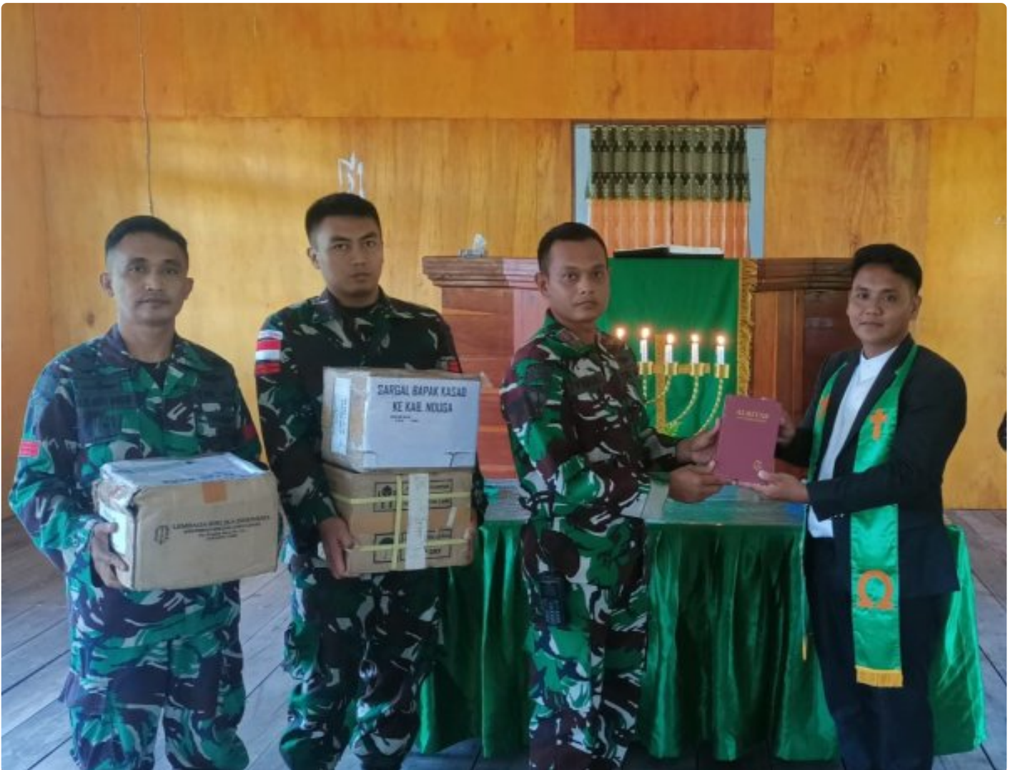
Foto: Satgas Yonif 503/Mayangkara kembali menunjukkan dedikasinya kepada masyarakat di Papua dengan memberikan dukungan alat musik untuk kegiatan ibadah di Gereja GKI Bethesda Batas Batu, Distrik Krepkuri, Kabupaten Nduga. Pada Minggu, 12 Januari 2025.